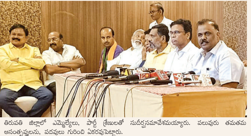
తిరుపతి జిల్లాలో ఎమ్మెల్యేలు, పార్టీ శ్రేణులతో సుదీర్ఘసమావేశమయ్యారు. పలువురు తమతమ అసంతృప్తులను, పదవులు గురించి ఏకరృపకావారు.

తిరుపతి, అక్టోబర్ 28 ప్రభాతవార్త: రాష్ట్రంలో అధికారంలోకి వచ్చిన ఎన్డీఎ ప్రభుత్వం, ముఖ్యమంత్రి చంద్రబాబునాయుడు 130 కోట్ల పానసు పూర్తిచేసుకున్నామని, ప్రజలకు మంచి చేయాలనే తపనతోనే ముఖ్యమంత్రి అమీరం కృషిచేస్తున్నారని తిరుపతి జిల్లా ఇన్ ఛార్జి మంత్రి అనగాని సత్యప్రసాద్ అన్నారు. ప్రభుత్వం అమలుచేస్తున్న సూపర్ సిక్స్ పథకాలు, ఫెన్షన్ పెంపు, రేషన్ సరఫరా, అన్ని వర్గాల ప్రజల సంక్షేమానికి అమలుచేస్తున్న పథకాలు గురించి క్షేత్రస్థాయిలో మంత్రులు, ఎమ్మెల్యేలు, పార్టీ నేతల ప్రజలకు తెలియజేయాలని జిల్లా ఇన్ ఛార్జి మంత్రి అనగాని సత్యప్రసాద్ తెలిపారు. తిరుపతి జిల్లా ఇన్ ఛార్జి మంత్రిగా నియమితులైన అనగాని సత్యప్రసాద్ తొలిసారిగా సోమవారం ఉదయం తిరుపతికి చేరుకున్నారు. ఇక్కడ తిరుపతి జిల్లాకు చెందిన టిడిపి ఎమ్మెల్యేలు, జనసేన ఎమ్మెల్యే, తిరుపతి జిల్లా టిడిపి నేతల ఘనస్వాగతం వరించారు. సోమవారం మధ్యాహ్నం జిల్లాకు చెందిన పార్టీల నేతలు, రాష్ట్రస్థాయి నేతలతో ఓ హోటల్ లో మంత్రి సమావేశమయ్యారు. జగన్ కుటుంబ వివాదంతో మాకు సంబంధంలేదని, తిరుపతి జిల్లాలో సత్కార్యాల నియోజకవర్గంలో కొన్ని సమస్యలు ఉన్నాయని, వాటిని పరిష్కరిస్తామన్నారు. పథకాలు క్షేత్రస్థాయిలో ప్రజలకు చేరాలి చూడాలని బాధ్యత మనందరిపై ఉందన్నారు. ఇచ్చిన ప్రతి హామీని నెరవేరుస్తున్నామని మంత్రి ఉద్ఘాటించారు. దీపావళికి ఉచిత సిలిండర్లు అమలుచేసే పండుగోహా మహిళలకు ఆనందంగా ఉండాలనేది చంద్రబాబు ఉద్దేశ్యమన్నారు. అనంతరం